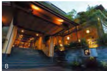
6 専用の銀泉内風呂を備えた趣向の異なる造りの多彩なコンセプトルームも用意 7 ゲストに感動を与える創作会席。四季折々の旬彩を伝統と革新を融合した様々な調理法で仕上げ提供 8 有馬温泉街で一番の高台に位置する喧騒を離れたロケーション

関西の奥座敷と呼ばれ、古来より数多くの貴族や文化人を癒し続けてきた日本三古湯のひとつ有馬温泉。その温泉街の中でも一番の高台に佇む『竹取亭円山』は、「今は昔、竹取の翁というものありけり」のくだりで馴染み深い、竹取物語を想起させる非日常の世界観を持つ温泉宿。館内には竹細工の小物が随所に置かれ、客室や貸切風呂、大浴場からはすらりと天を突く竹林を眺められる設計に。かぐや姫に成り代わったような心持ちで、美しい情景に浸ることができる。 有馬温泉には空気に触れると赤褐色に変化する「金泉」とラジウム含有量が豊富な「銀泉」があり、館内ではこの2つを多彩な湯船で存分に堪能できる。男女それぞれの大きな大浴場のほか4つの貸切露天風呂を用意。四季の風景を眺めながらの湯浴みは格別の趣があり、滞在中どれも無料で利用できる。心地良い耳触りの温泉の音や山間を抜ける清々しい風、森に住む小鳥たちが奏でるさえずり。自然が造りだすBGMを聞きながら、大切な人とのかけがえのない時間を過ごすことができるだろう。