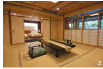
1 金泉露天風呂付き「月見の間スイート」の和室とベッドルーム 2 重厚な石造りの銀泉露天風呂を備えたスイートルーム「竹取亭スイート404」 3 「竹取亭スイート」には落ち着いた雰囲気のとんとんとした和室とモダンなベッドルームが備わる 4 銀泉露天風呂付き客室「竹取亭スイート403」の露天風呂ゾーン