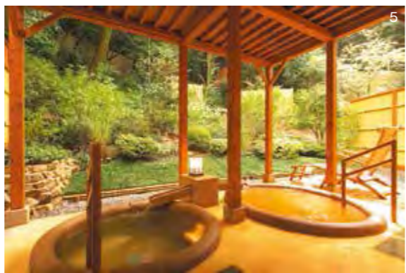
9 風合いのある苔むす庭園と竹林を望む貸切露天風呂「二の湯」。広々とした銀泉湯船と趣のある金泉湯船を配した湯処