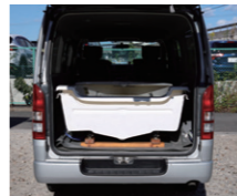
ハイエースに格納中